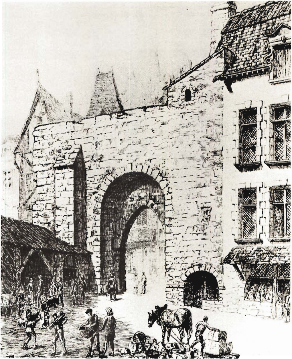
Les restes de la porte Mallevault et la Grande-Boucherie, place du Marché, d'après Masse